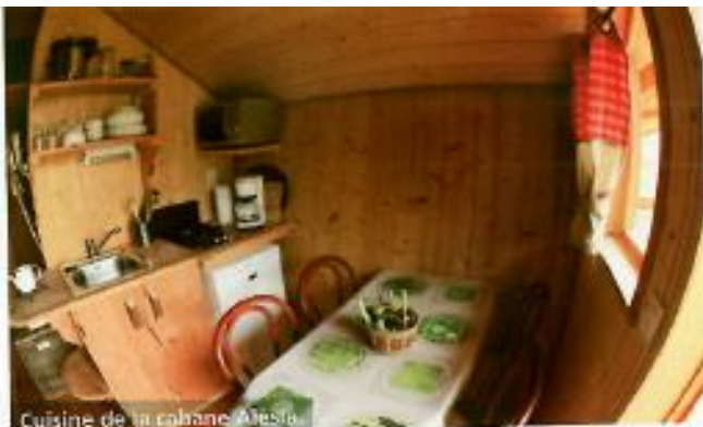
Cuisine de la cabane Alesia.