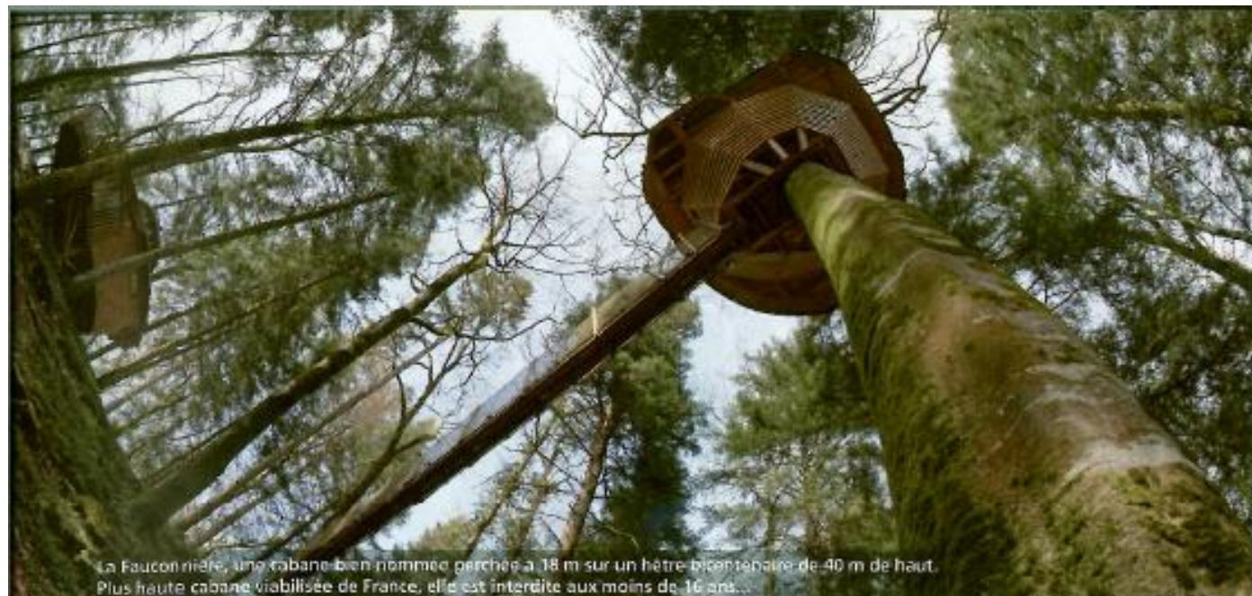
La Fauconnière, une cabane bien nommée perchée à 18 m sur un hêtre bicentenaire de 40 m de haut. Plus haute cabane viabilisée de France, elle est interdite aux moins de 16 ans...