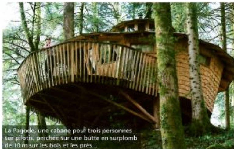
La Pagode, une cabane pour trois personnes sur pilotis, perchée sur une butte en surplomb de 10 m sur les bois et les prés...