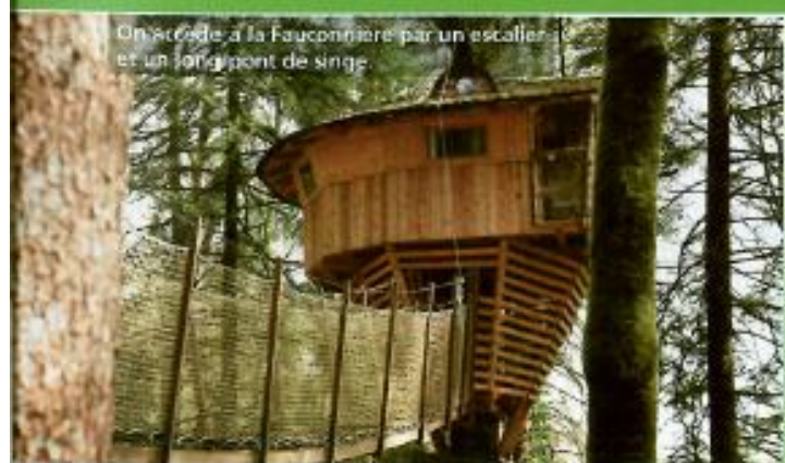
On accède à la Fauconnière par un escalier et un long pont de singe.