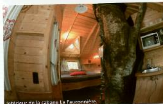
Intérieur de la cabane La Fauconnière.