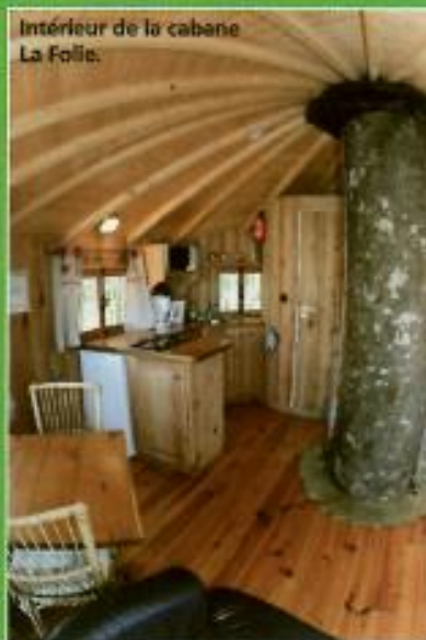
Intérieur de la cabane La Folie.