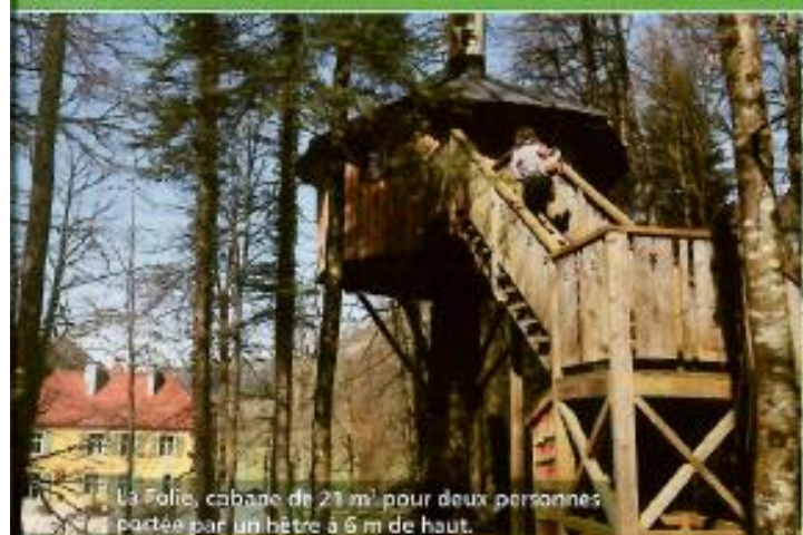
La Folie, cabane de 21 m 2 pour deux personnes perchée par un hêtre à 6 m de haut.