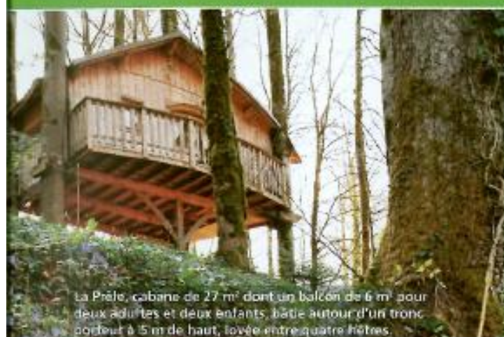
La Prêle, cabane de 27 m 2 dont un balcon de 6 m 2 pour deux adultes et deux enfants, bâtie autour d'un tronc porteur à 15 m de haut, lovée entre quatre hêtres.